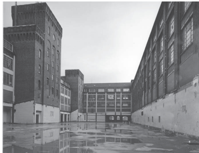
Innenhof der Adlerwerke Frankfurt (1993) Im dritten und vierten Stock befand sich das KZ

Die 1600 Häftlinge - meist junge Männer aus dem Warschauer Aufstand - die gnadenlos für die Rüstungsprodukti-